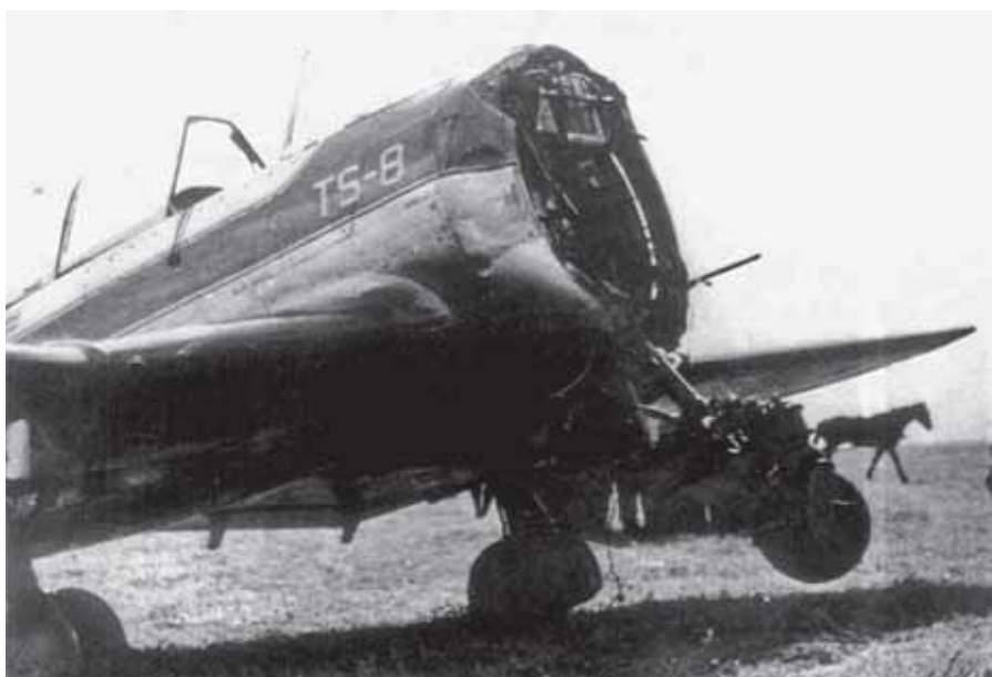
Wypadek TS -8 Bies (lądowanie bez silnika)

(niezbędne do wyrobienia nawyków startu i lądowania przy przejściu na myśliwskie samoloty odrzutowe typu MiG 15/17) prędkość 1,5 razy większa, niż dla Junaków (samolot opisywany w poprzednim odcinku WG), czyli około 300 km/h, bogate wyposażenie: przrządy do lotów bez widoczności, radiostację, radiowysokościomierz, radiogoniometr itp. Ponadto, dla przyzwyczajenia młodych pilotów, miał posiadać różnorodne instalacje tj. hydrauliczną, pneumatyczną itp. Musiał być także dopuszczony do akrobacji. Były to jak na owe czasy wymagania dość duże. Do tego konstruktorzy nie dysponowali odpowiednim silnikiem, więc konieczne było opracowanie nowej jednostki napędowej. Zlecenie to dostał inż. Wiktor Narkiewicz, który wzorował się na amerykańskim silniku Jacobs. Powstały w ten sposób silnik WN-3 miał moc 330/KM. Był on pierwszym silnikiem polskiej konstrukcji po II wojnie światowej. Duża średnica silnika pociągała z sobą dużą średnicę kadłuba. Przy konstruowaniu Biesa wykorzystano doświadczenia przy budowie przedwojennych maszyn wojsko-