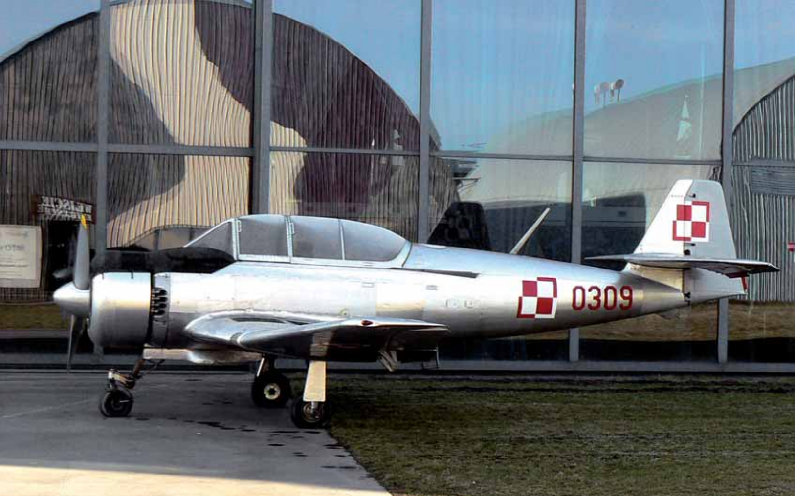
TS-8 Bies eksponat Muzeum Lotnictwa Polskiego w Krakowie

łących pilotów najczęściej stawianym zarzutem było to, że był zbyt łatwy w pilotażu, co niedostatecznie przygotowywało pilotów do późniejszych lotów na bojowym samolocie odrzutowym – wówczas Mig 15/ Lim-2. Natomiast wojsko polskie było bardzo zadowolone z samolotu, przy okazji wprowadzania w latach 90. ubiegłego wieku szkolnych samolotów PZL 130 Orlik mówiono: dajcie nam coś równie dobrego, jak Bies. Życzenia, uwagi lotników spełniły się. Następca Biesa PZL 130 Orlik, który jest użytkowany do dnia dzisiejszego, cieszy się bardzo dobrą opinią wśród personelu latającego i naziemnego.